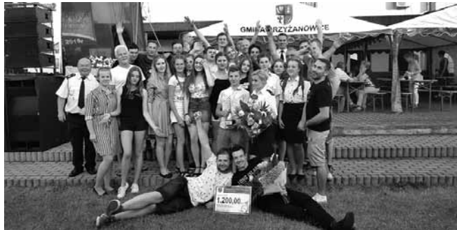
Orkiestra Dęta Gminy Bestwina z siedzibą w Kaniowie

Tworków w gminie Krzyżanowice i czeski Bohumin były w dniu 9 czerwca arenami zmagania muzyków w ramach VII Międzynarodowego Festiwalu Orkiestr Dętych . Na scenie zaprezentowały się orkiestry dęte z Gdowa (woj. małopolskie), Kłomnic – (okolice Częstochowy), Jaworza oraz z Czech (z Hradca nad Moravicí, Koprivnic i Havířova). Nie zabrakło także Orkiestry Dętej Gminy Bestwina z siedzibą w Kaniowie, która decyzją Jury zdobyła pierwsze miejsce.