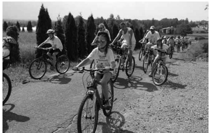
Janowicki Rajd Rowerowy