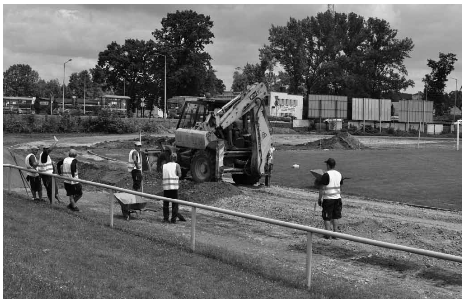
Budowa kompleksu lekkoatletycznego

Trwają prace związane z budową kompleksu lekkoatletycznego składającego się z bieżni i urządzeń lekkoatletycznych przy boisku sportowym w Bestwinie. Zakres prac do wykonania obejmuje m.in. zagospodarowanie terenu obejmującego lokalizację urządzeń lekkoatletycznych przy boisku sportowym. Budowę bieżni o nawierzchni syntetycznej, budowę skoczni do skoku wzwyż i do skoku w dal, oraz budowę rzutni do pchnięcia kulą. Termin realizacji prac przewidziano do końca września br., a część środków pochodzi z dotacji Ministerstwa Sportu i Turystyki.