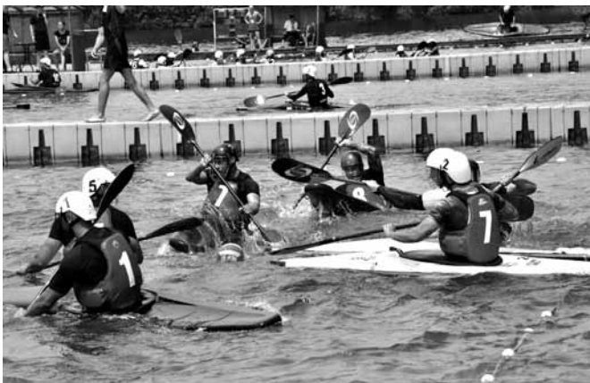
Międzynarodowy Turniej Kajak-Polo