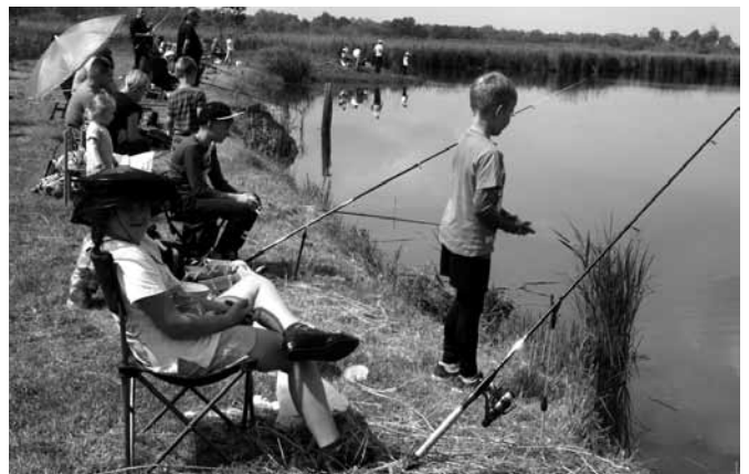
Zawody wędkarskie z okazji Dnia Dziecka