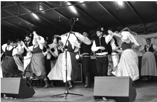
Dni Gminy Bestwina