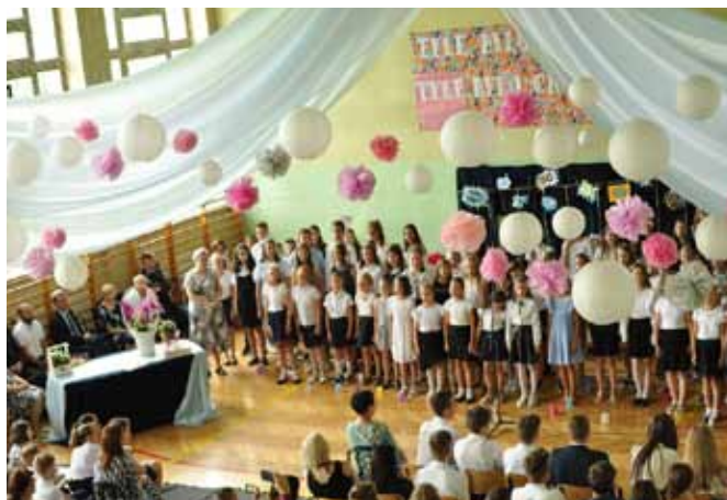
W szkołach odbyły się uroczyste akademie

o tyle specyficzny rok, że kończą go zarówno uczniowie gimnazjów, jak i klas ósmych. Spotkają się razem w szkołach średnich, w tych samych klasach.