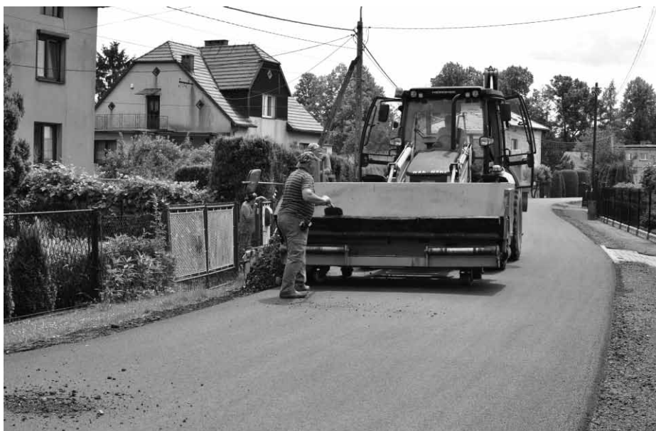
Remont ul. św. Floriana w Bestwinie

Referat Służb Technicznych UG w Bestwinie